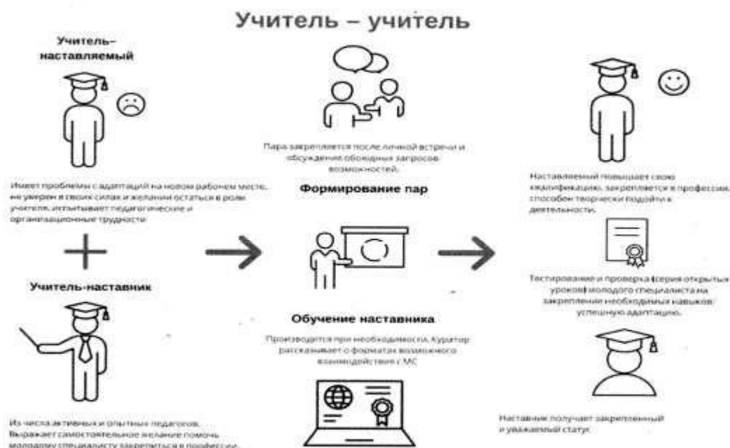
Рис. 2. Графическое представление реализации программы наставничества по форме «учитель – учитель».